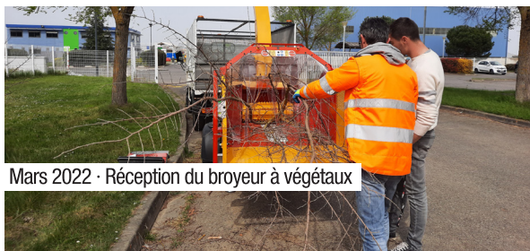
Mars 2022 · Réception du broyeur à végétaux