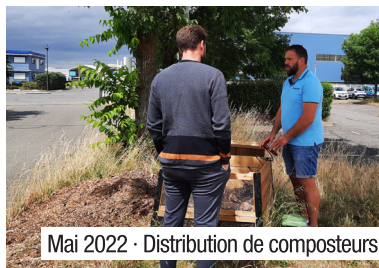
Mai 2022 · Distribution de composteurs