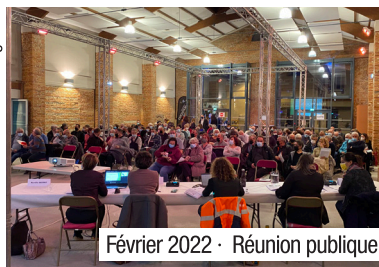
Février 2022 · Réunion publique